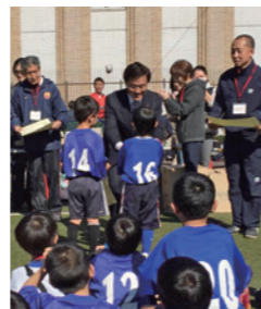
サッカー大会で子供たちを表彰