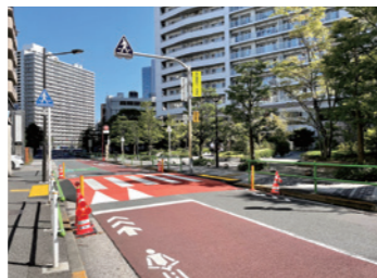
交通安全対策に取り組む