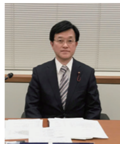
議会運営、予算特別、建設常任の各委員長等を務める