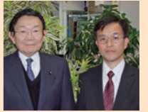
与謝野馨 秘書時代