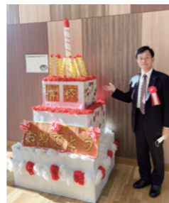
芝浜小学校開校記念式典に出席