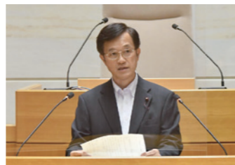
代表質問や総括質問を行う