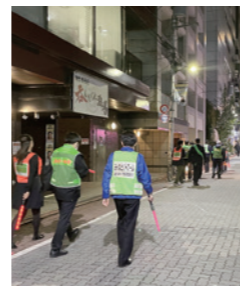
地域の防犯パトロール活動に参加